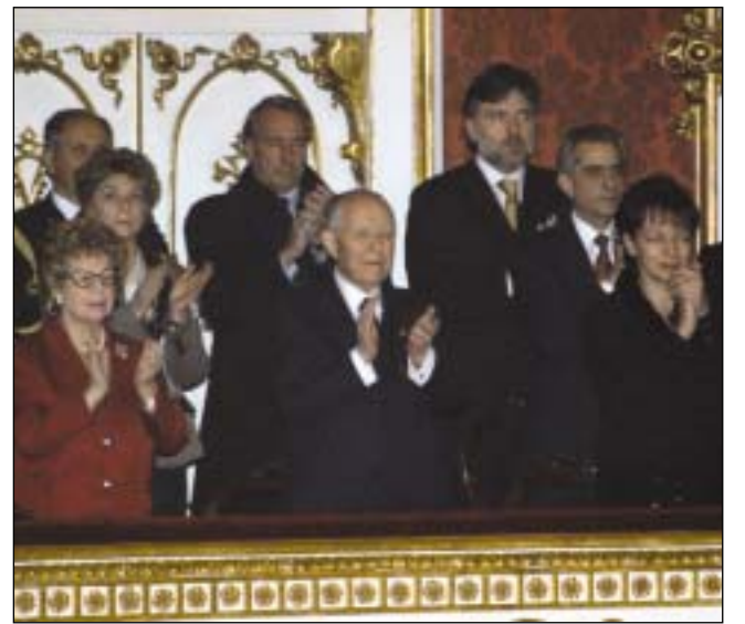
L'Accademia nazionale di Santa Cecilia riceve gli applausi dal palco d'onore delle autorità al termine del concerto per la festa Tricolore.