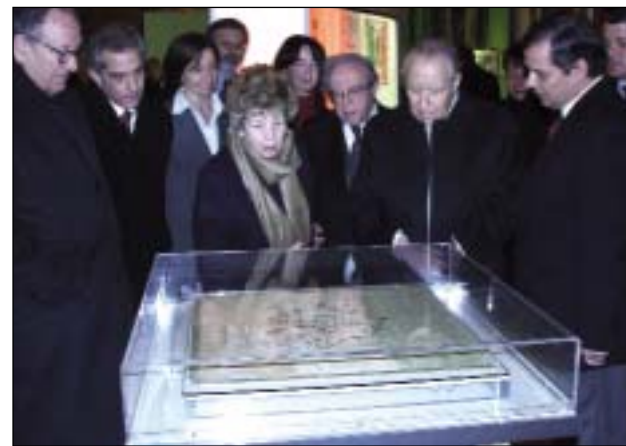
Il messaggio-ricordo che Ciampi ha scritto per Reggio inaugurando l'albo d'oro del comune capoluogo

A Reggio Emilia, città culla del Tricolore; a Reggio, insignita della medaglia d'oro al valor militare per la sua strenua resistenza offerta all'anno passato avanti, con il sacrificio di compartimenti dei suoi figli caduti in combattimento; a Reggio, città operaia, ricca di imprese all'avanguardia dell'industria e della si sempre; a Reggio, nota per la eccellenza della sua scuola superiore, simbolo di una comunità sociale che ha avuto il ruolo nella cultura artigiana e laica della sua parte, il mio augurio di buon lavoro e di ulteriori progressi. 7 gennaio 2004 Carlo Azeglio Ciampi