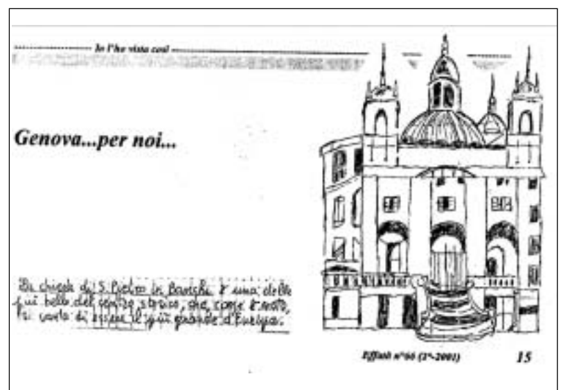
I ricordi della propria terra ligure nel disegno di uno dei redattori pubblicato su "Effatà".

"Con una copertina un po' insolita vogliamo catturare l'attenzione e