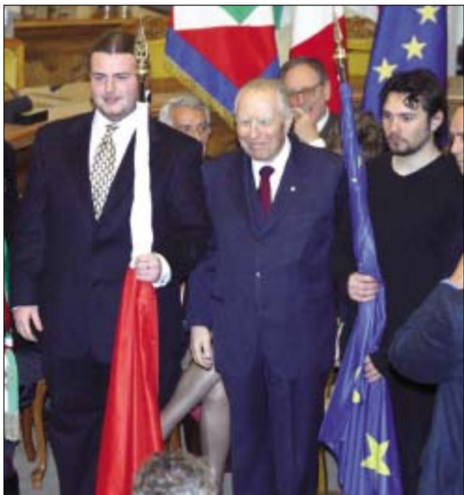
Il presidente Ciampi consegna la bandiera italiana e europea agli studenti del liceo "Ariosto-Spallanzani"

A Reggio Emilia, città culla del Tricolore; a Reggio, insignita della medaglia d'oro al valor militare per la sua strenua resistenza offerta all'anno passato avanti, con il sacrificio di compartimenti dei suoi figli caduti in combattimento; a Reggio, città operaia, ricca di imprese all'avanguardia dell'industria e della si sempre; a Reggio, nota per la eccellenza della sua scuola superiore, simbolo di una comunità sociale che ha avuto il ruolo nella cultura artigiana e laica della sua parte, il mio augurio di buon lavoro e di ulteriori progressi. 7 gennaio 2004 Carlo Azeglio Ciampi