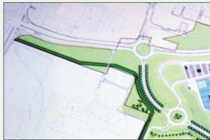
Nella foto: la piantina urbanistica.