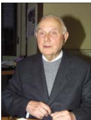
di Ugo Bellocchi

La visita del Presidente della Repubblica nella nostra città è stata un'occasione per evidenziare due titoli storici di cui siamo legittimamente orgogliosi: la Repubblica Reggiana e il Primo Tricolore.