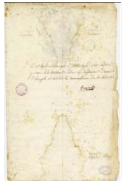
Lettera del 7 ottobre 1796 inviata da Napoleone ai reggiani, con sottoscrizione autografa.