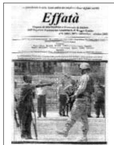
La testata di "Effatà", l'organo d'informazione e di dialogo dell'O.P.G. di Reggio Emilia.