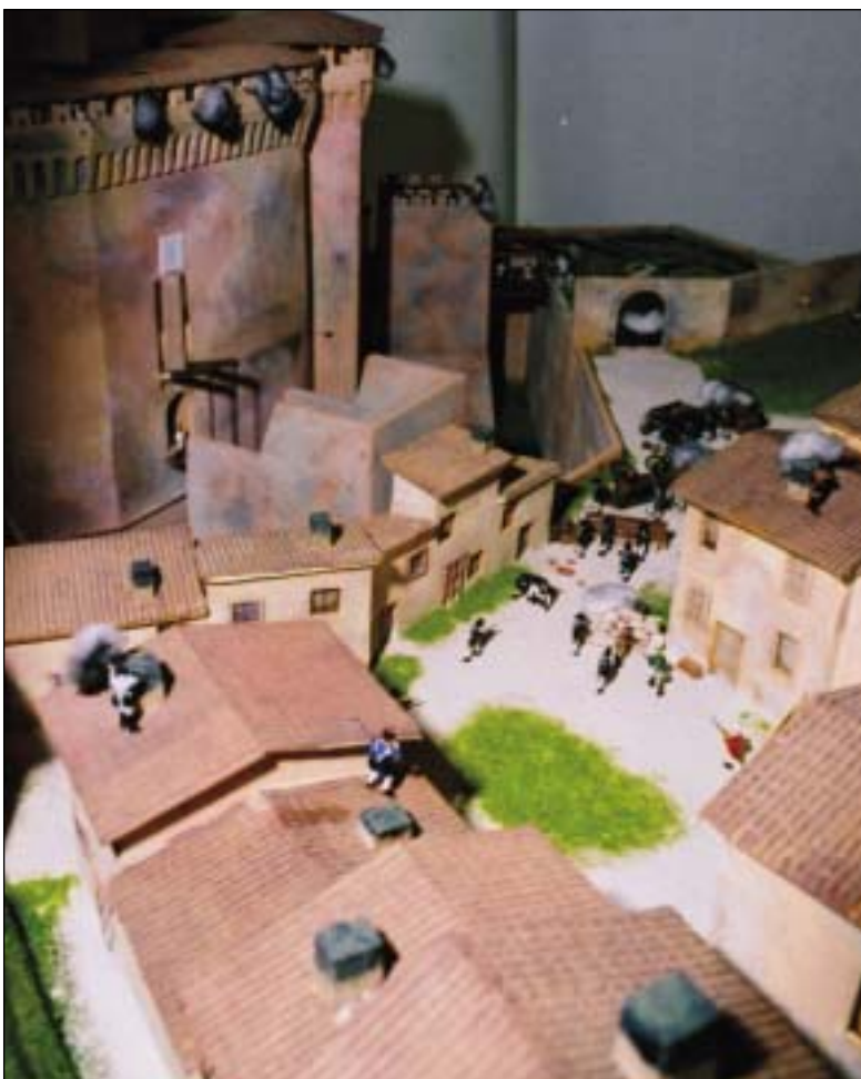
Plastico della battaglia di Montechiarugolo, particolare (opera di G. Dallari Brusita, in Archivio di Stato di Reggio Emilia).

quentata anche "dalla studiosa gioventù". Un angolo della nostra città predestinato alla cultura: ieri una biblioteca oggi l'Archivio di Stato.