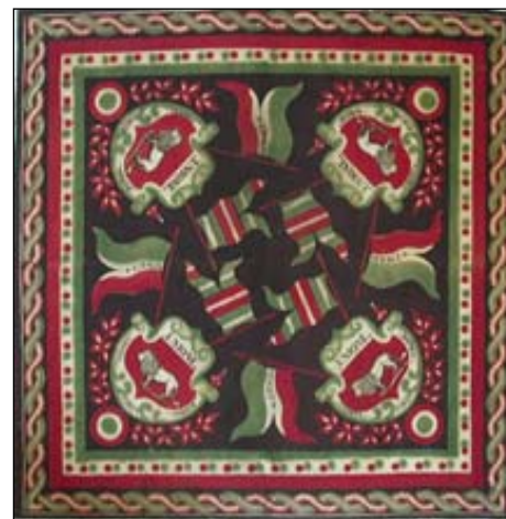
Una copia della riproduzione del fazzoletto ottocentesco "Unione, forza, patria, libertà" realizzata per l'occasione dal Lions Club di Reggio e Max Mara