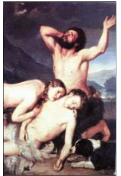
Nella foto in alto a sinistra: la copertina del libro Sopra il famoso dipinto: "Adamo ed Eva che piangono sul cadavere di Abele"

escursioni nel campo dell'arte, dove le parole hanno il loro colore, la loro funzione, ma anche il loro peso critico, storico e culturale.