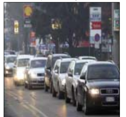
Per l'Assessore troppe auto circolano per la città

Bisognerebbe che i giovani s'impegnassero di più in politica. Noto con dispiacere il loro disimpegno sia per quanto riguarda i berlusconiani che per i giovani di sinistra. Se per i primi passa il menefreghismo e la cultura del look, ai giovani di sinistra manca la volontà di impegnarsi, o per estremo rigore o perché si considera la politica un gioco fastidioso.