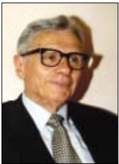
Pagina a cura di Gaetano Montanari

Le più belle opere dell'artista brescellese raccolte in un bellissimo e documentato libro di Filippo Silvestro. Il famoso dipinto su Adamo ed Eva esposto all'Accademia di Brera