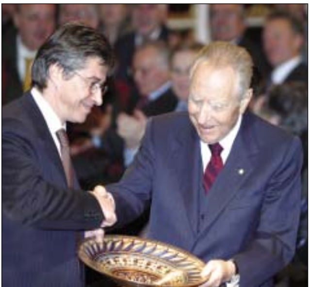
La stretta di mano tra Ciampi e il presidente della regione Emilia Romagna, Vasco Errani