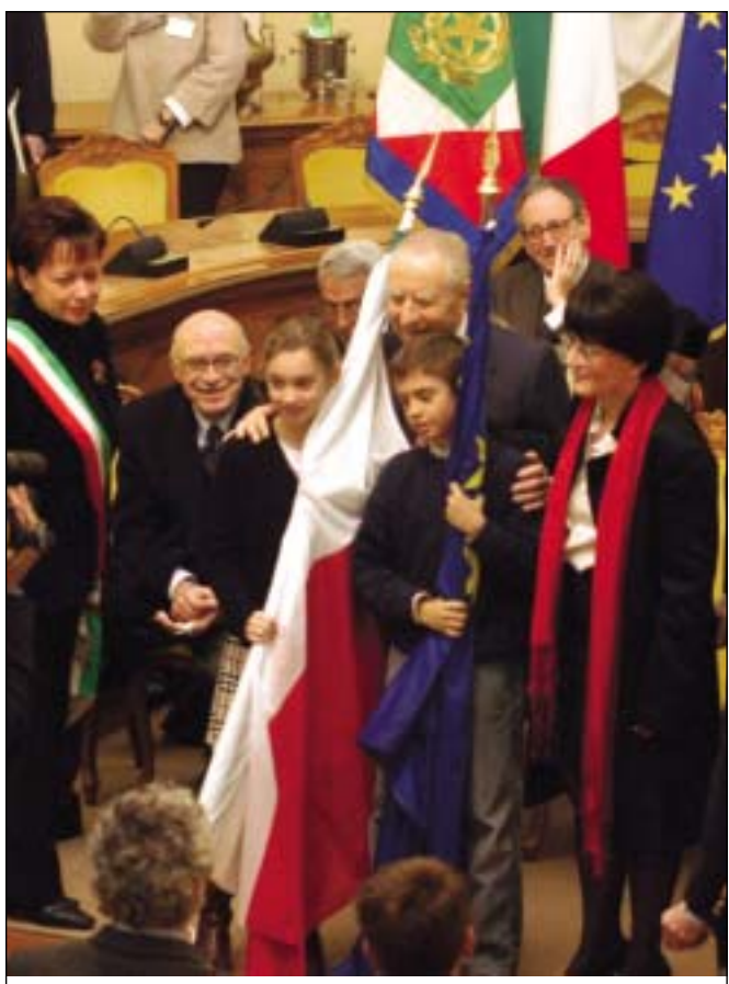
Il dono del Capo dello Stato ai bambini della elementare "Zibordi"