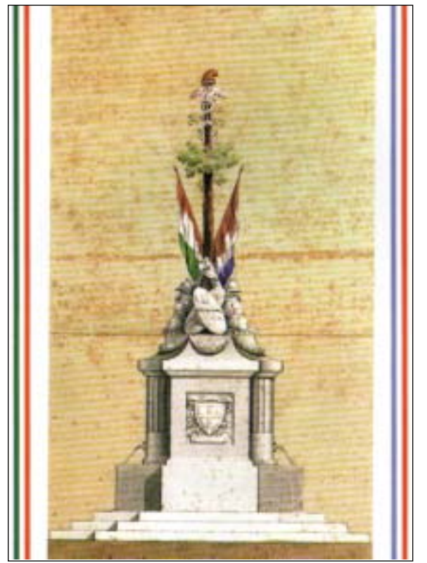
Nella piazza Maggiore di Reggio - piazza del Duomo - dove ancor oggi esiste la fontana del Crostolo, venne eretto l'Albero della Libertà con i colori Italiani e Francesi

Il 9 gennaio 1797 il secondo Congresso Cispadano conclude i propri lavori nella nostra città. Si riconvoca in Modena per il terzo Congresso, il quale si apre il 21 gennaio 1797 ratificando e rendendo esecutivi taluni provvedimenti adottati a Reggio Emilia il 7 gennaio. Fra questi, il decreto istitutivo dello "Stendardo, o Bandiera Cispadana di tre Colori Verde, Bianco e Rosso