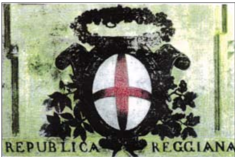
L'unico stemma rimasto della Repubblica Reggiana (per quanto ancora?) è visibile sopra la porta d'ingresso dell'ex Orfanotrofio femminile in via Franchetti, già via Albergo dei Poveri. Fu dipinto fra il 17 e il 26 settembre 1796.