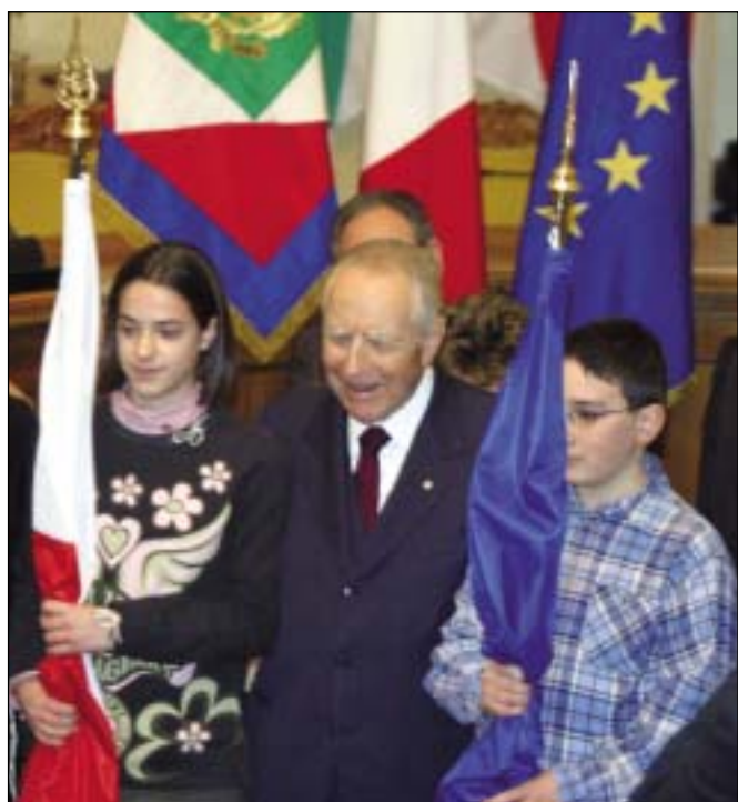
Il Presidente con i ragazzi della media "Vallisneri" di Scandiano in sala del Tricolore