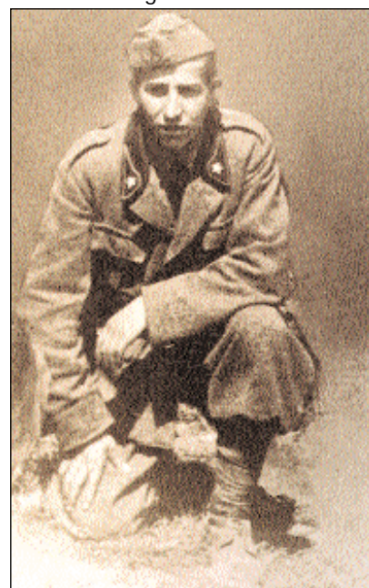
Quarto Camurri arrestato e fucilato con i sette fratelli Cervi

Abbiamo lavorato perché Casa Cervi diventasse un Museo che sapesse tenere ben viva nella coscienza delle nuove generazioni la memoria