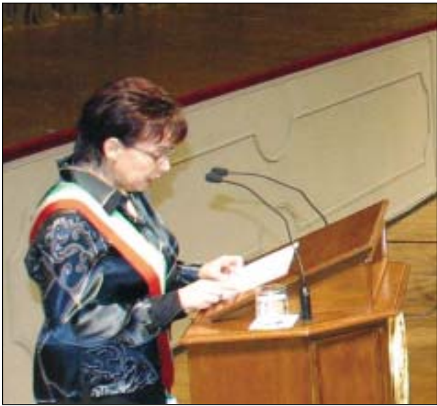
Il teatro Valli gremito di autorità durante i discorsi del presidente Ciampi e del sindaco Spaggiari