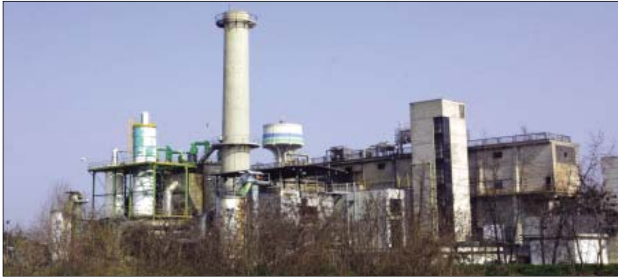
L'inceneritore di Cavazzoli

Puntiamo ad intervenire in modo struttu-