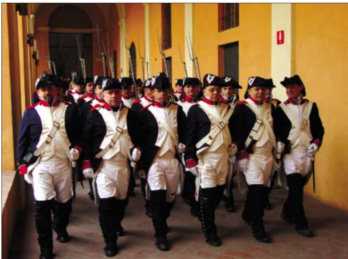
Foto sopra: figuranti indossano la divisa della "Guardia Civica" di due secoli fa. L'iniziativa è stata organizzata dall'Associazione Nazionale "Comitato Primo Tricolore". Foto al centro, in alto, in bianco e nero: l'arma della Repubblica Cispadana, che compare nel bianco del Primo Tricolore, è riprodotta in alcuni rarissimi manifesti del nuovo Stato Repubblicano.