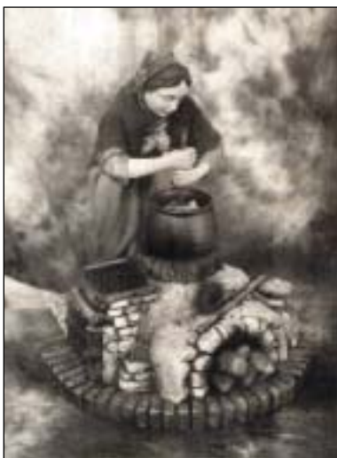
Nella foto sopra: la polenta è ricordata anche nelle statue del presepio A sinistra: la copertina del libro

E, nel capitolo settimo ed ultimo, ai "Proverbi e modi di dire reggiani concernenti la polenta". Il professor Mazzaperlini, a nostro sommo merito di saper destare nel lettore il piacevole bisogno di giungere alla fine del capitolo. E' vivo, colto, non annoia, dotato com'è di una immediatezza di lingua e facilità di espressione. Stupisce senza averne l'aria e rievoca usi e costumanze con toni di colta umanità che riescono sempre a penetrare nel profondo dell'animo e a coinvolgere.