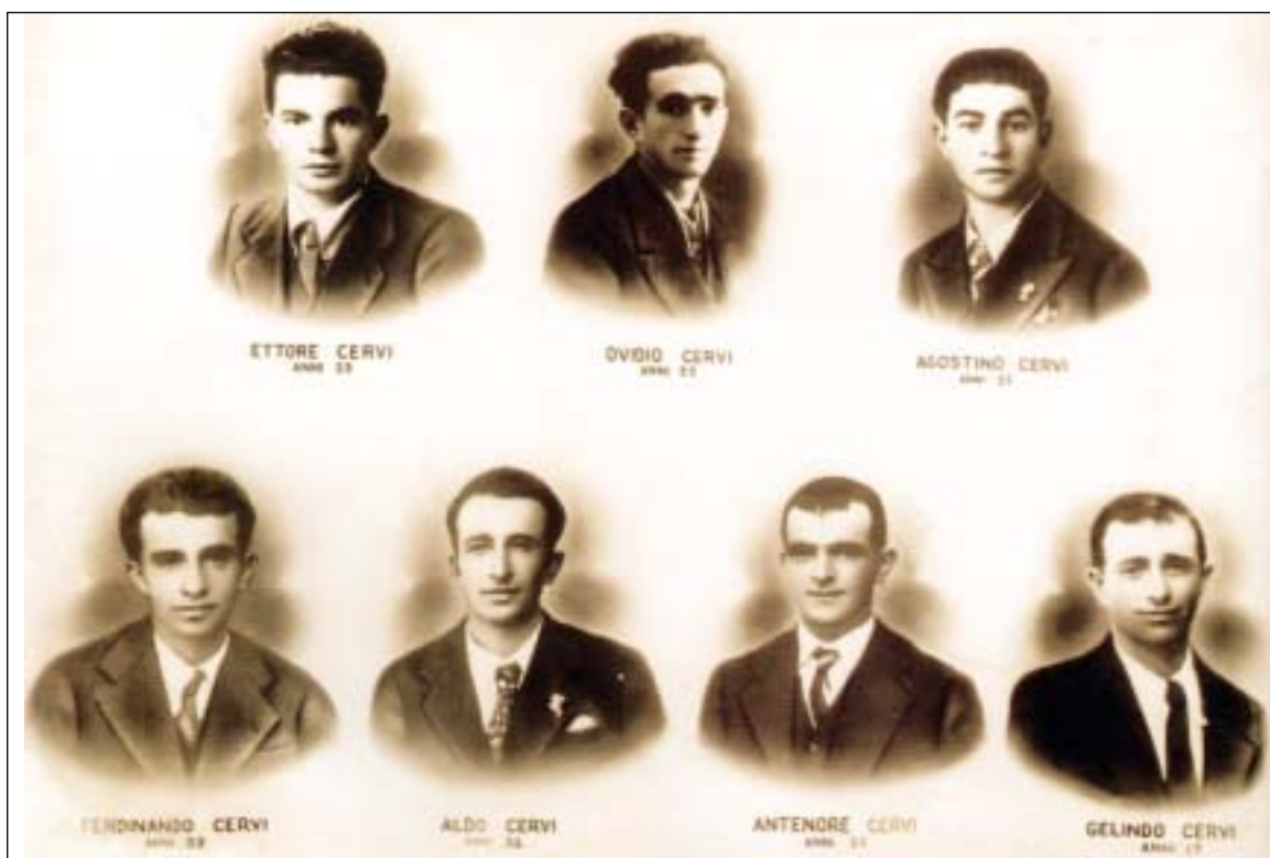
Cartolina ricordo dei sette fratelli Cervi

Ricordando i sette fratelli Cervi e con loro tutti i nostri martiri abbiamo