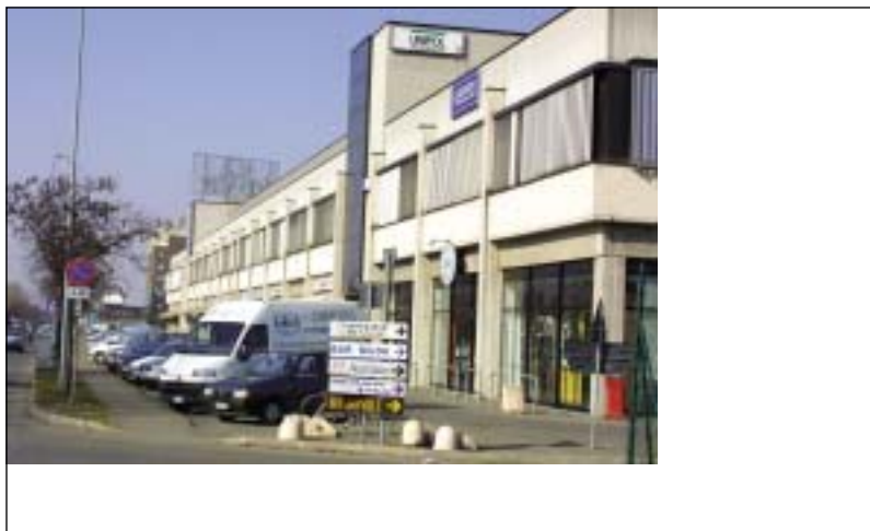
Nella foto: La sede di Agraria in via Kennedy

Se le ragioni dei vertici delle istituzioni universitarie sono giustificate, soprattutto in un momento così difficile per il mondo universitario italiano, alle prese con una drastica riduzione dei finanziamenti di Stato e Regioni, d'altro canto sorgono forti perplessità