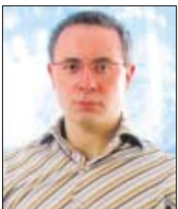
di Gianfranco Parmiggiani

E' tornato a Reggio Emilia dopo 5 anni, questa volta in qualità di Presidente della Repubblica. Nel '99, con l'Europa che si stava unendo anche attraverso la moneta, era un semplice ministro. Oggi, come allora, a fianco di Carlo Azeglio Ciampi c'era la moglie, la "reggiana" Franca Pilla. Sono cambiate molte cose da quella fine '900 a questo inizio 2000, come se,