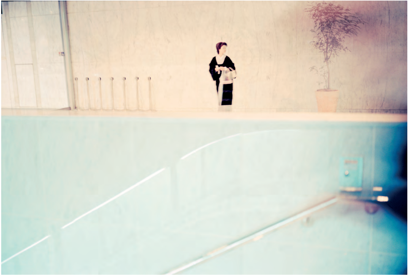
Sopra: Geisha. Tokyo 2010

so influenzi il mio sguardo: la fotografia non è solo immagine, è processo, è costruzione, è ascolto e attesa.