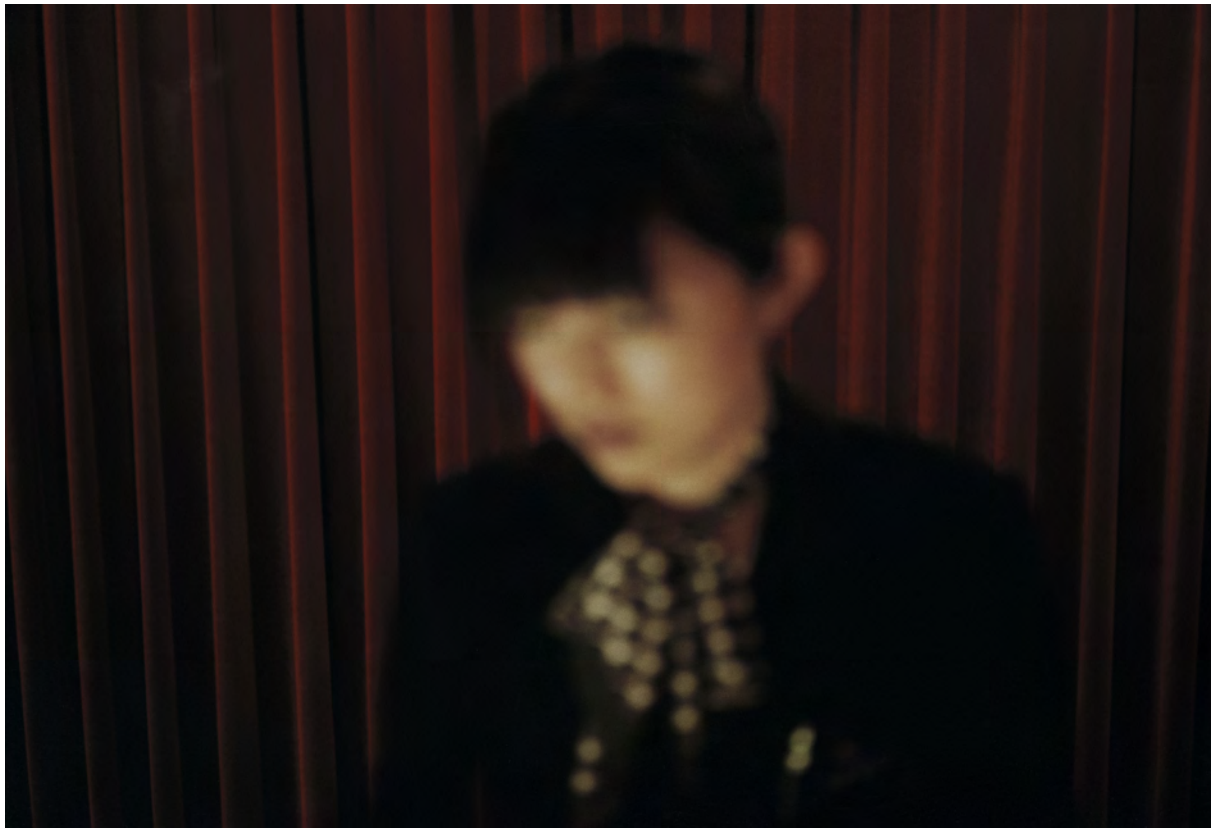
Sopra: Tokyo #Untitled

Sì, ho tutta una serie di fotografie dei miei inizi quando ancora non avevo scelto di indirizzare il mio lavoro verso una fotografia meno apparentemente sociale che non ho mai mostrato pubblicamente, parlo delle immagini scattate a Gaza nei primi anni 2000, troppo dure. Quell'esperienza mi ha creato una crisi profonda rispetto al mezzo ed è stata una tappa fondamentale per innescare un cambiamento decisivo passando a un'altro modo di guardare le cose, iniziando così con la fotografia a colori, tipo di fotografia che mi ha poi permesso le collaborazioni più importanti.