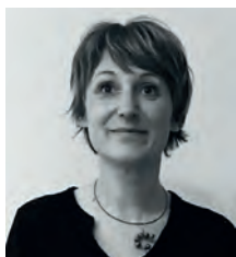
di Andreina Pezzi

Dal reportage allo scatto industriale, dal rigore analogico alla costruzione di un archivio come atto di responsabilità e memoria: il fotografo Alessandro Rizzi ci racconta un mestiere in costante evoluzione. Un racconto intimo di visioni che resistono al tempo e insegnano a vedere oltre l'immagine