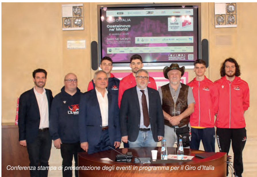
Conferenza stampa di presentazione degli eventi in programma per il Giro d'Italia

L'Emilia-Romagna è infatti ancora una volta tra le regioni protagoniste del Giro d'Italia. Un legame profondo quello con la più importante competizione ciclistica su strada italiana e tra le più prestigiose al mondo, che si conferma per la 108ª edizione, che partirà il 9 maggio dall'Albania per concludersi il 1º giugno a Roma.