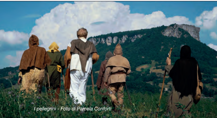
I pellegrini