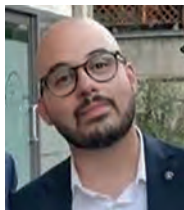
di Antoni Calamunci

Un'indagine giornalistica che si è trasformata in un'opera filmica che unisce archeologia, letteratura, storia, spiritualità e fenomeni inspiegabili. Massimo Dallaglio, regista, giornalista e DOP (direttore della fotografia) di Reggio Emilia, ci racconta, in questa intervista per Stampa Reggiana, la genesi del docufilm dedicato alla Pietra di Bismantova, simbolo dell'Appennino reggiano, luogo carico di energia e fascino. Dai reperti risalenti all'età del bronzo, alle tracce di un antico castello, agli echi della Divina Commedia, fino ad arrivare alle leg-