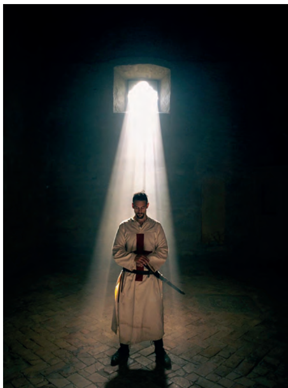
Sopra: immagini dal docufilm