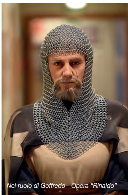
Nel ruolo di Goffredo - Opera "Rinaldo"