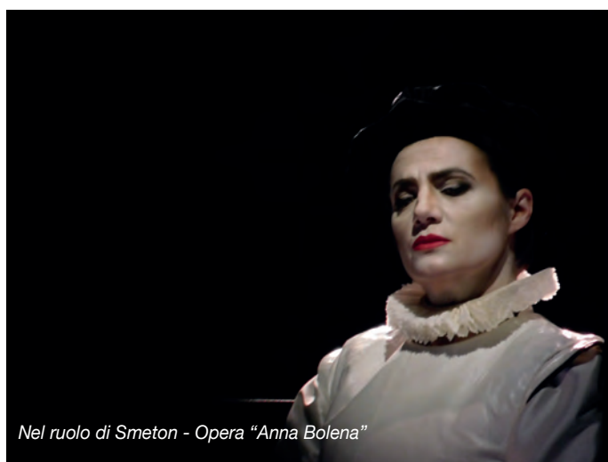
Nel ruolo di Smeton - Opera "Anna Bolena"