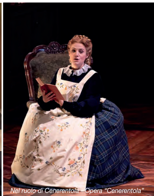
Nel ruolo di Cenerentola - Opera "Cenerentola"

fu necessario fare tanti sacrifici e per molto tempo. Anche perché i risultati per un giovane cantante appena diplomato non arrivano subito.