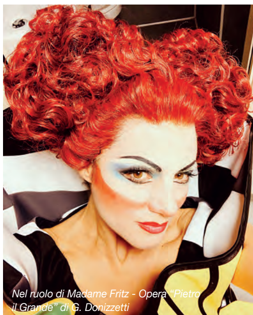
Nel ruolo di Madame Fritz - Opera "Pietro il Grande" di G. Donizzetti